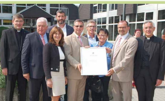
Feierlichkeiten zum 30. Jubiläum der WfbM St. Elisabeth in Sinzig

Die Caritas Werkstätten konnten in diesem Jahr gleich drei besondere Geburtstage feiern: Im August beging die WfbM St. Elisabeth in Sinzig ihr 30-jähriges Bestehen. Im September folgte das Sozialkaufhaus LISA in Remagen mit seinem 10-jährigen Jubiläum. Und auch die INTEC-Betriebe in Cochem konnten in diesem Jahr auf 20 erfolgreiche Jahre zurückblicken.