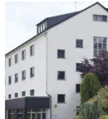
Wohnheim St. Elisabeth, Mendig