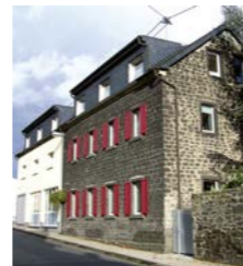
Tagesförderung Haus in der Heiden- stockstraße, Mendig