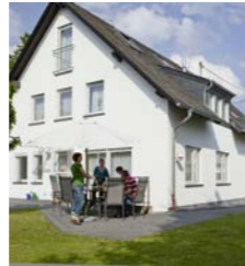
Haus Kröll, Mendig