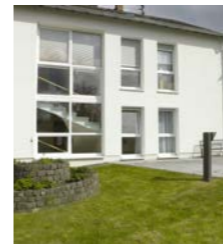
Tagesförderung Haus am Wallgraben, Polch