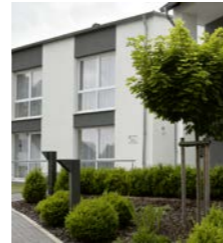
Haus am Wallgraben, Polch