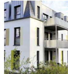
Haus in der Koblenzer Straße, Mayen