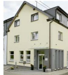
Haus in der Heiden- stockstraße, Mendig