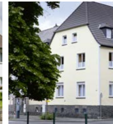
Haus an der Nette, Mayen