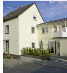
Haus Vis-à-Vis, Mendig