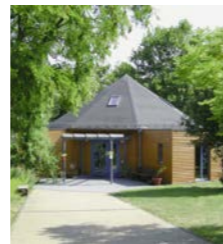
Tagesförderung Pavillon, Mendig