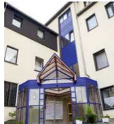
Wohnheim St. Nikolaus, Mendig