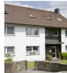
Haus Trimborn, Mayen