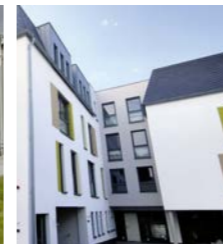
Tagesförderung Haus in der Koblenzer Straße, Mayen