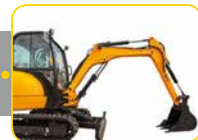
II. Quartal 2018 Abriss Marienkirche