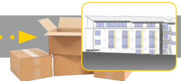
IV. Quartal 2019 Einzug