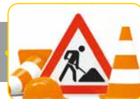
II. Quartal 2018 Baubeginn