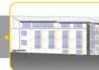
III. Quartal 2019 Fertigstellung Neubau